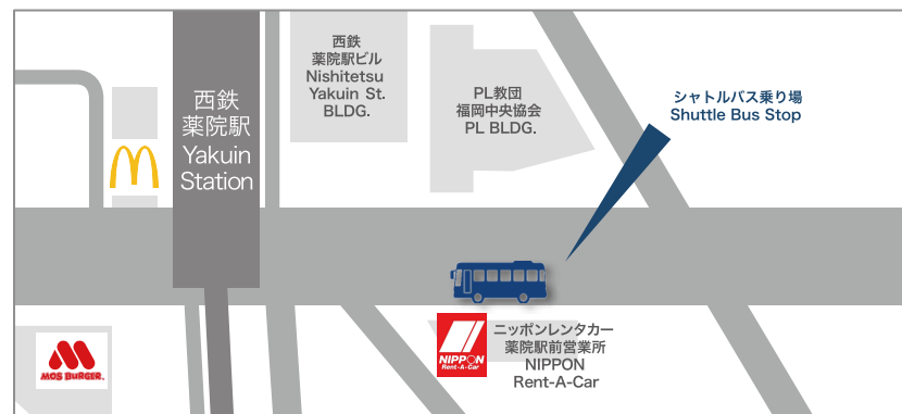
西鉄 薬院駅前シャトルバス乗り場 Shuttle Bus Stop of Yakuin St.

( )内は薬院駅発車時刻 0=from Yakuin St. ※片道の所要時間は約30分 Approx. 30min for one way